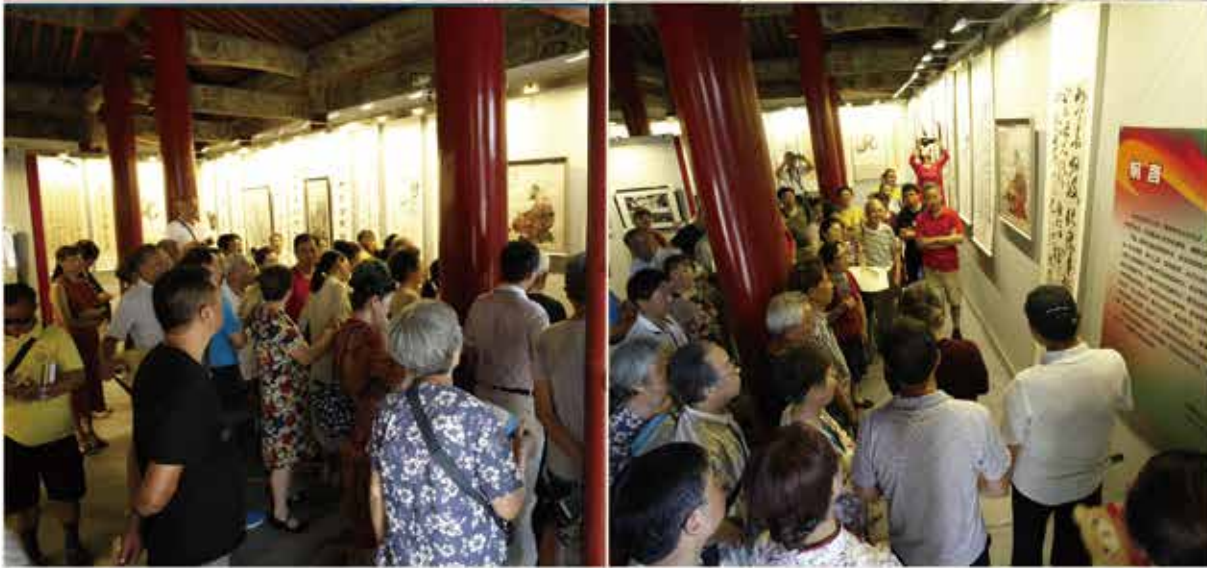
“扬帆新时代 共筑艺术梦” ——南通市文化馆公益艺术培训十周年成果展