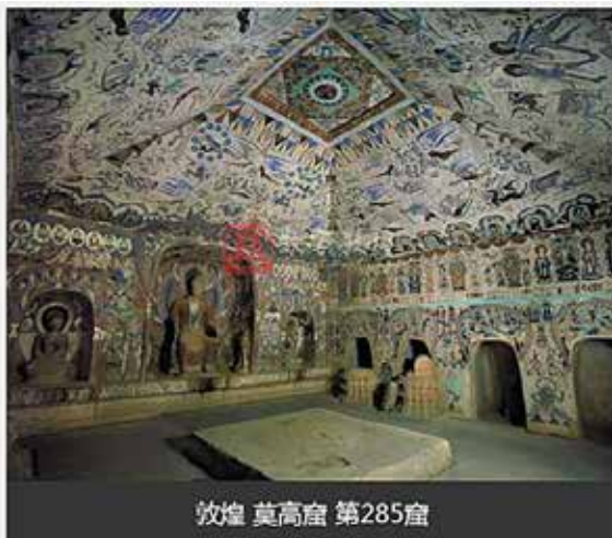
敦煌 莫高窟 第285窟

◎ 第254窟建于北魏。洞窟位于莫高窟崖面中层，是莫高窟最早的中心塔柱式洞窟。洞窟前部为人字坡顶，人字坡南北两端