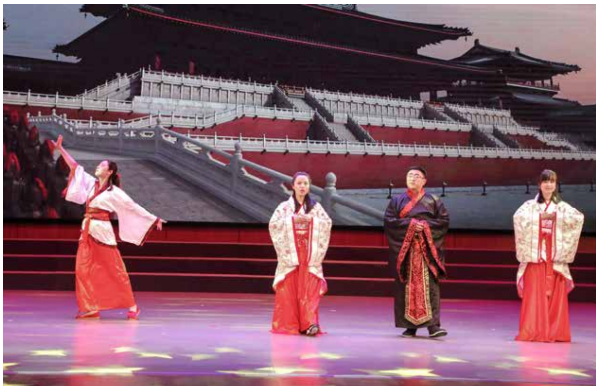
·如东县文化馆“生命美在阅读”诵读中华经典、抗疫优秀作品大赛。