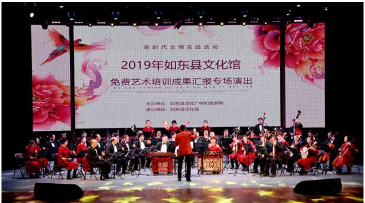
2019 如东县文化馆免费艺术培训成果汇报专场演出。