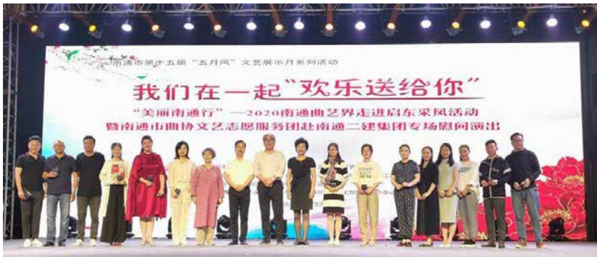
· “美丽南通行”走进启东采风活动。