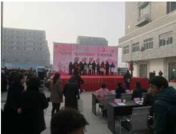
·启东文化进万家活动。