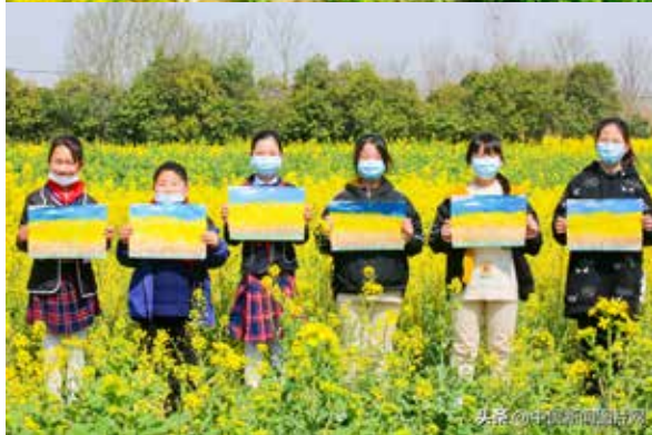
· 如皋市磨头镇塘湾村的小朋友在油菜花田间画画。