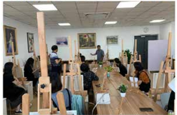
·崇川区区级机关文化公益课堂开课。