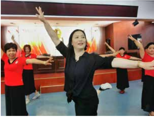
·海门区文化馆举办艺术培训。