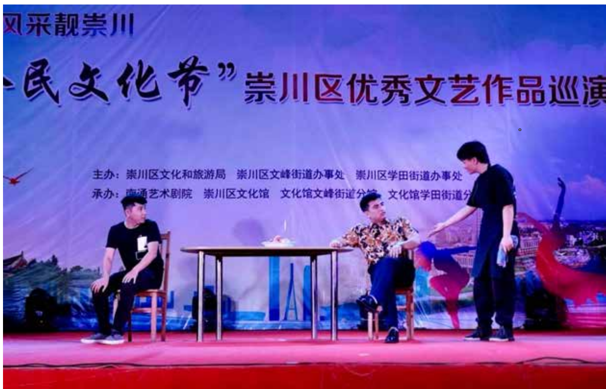
· “全民文化节”崇川区优秀文艺作品巡演。