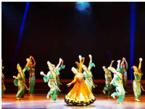
· 崇川区圆梦舞蹈团参加南通市“红石榴杯”少数民族优秀舞蹈选拔赛。