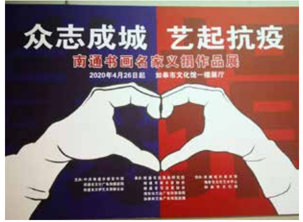
·南通书画名家义捐作品展。