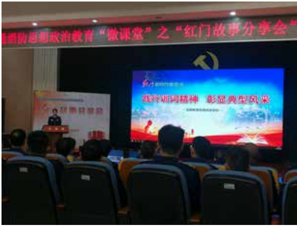
·启东市文化馆举办红门故事分享。