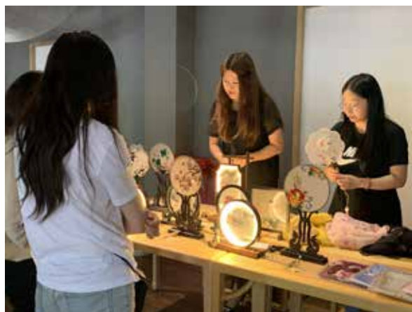
·上图 海门区文化馆非遗展示活动。