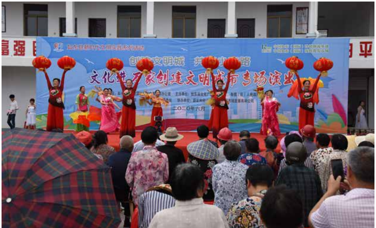
·如东县新时代文明实践系列活动“创建文明城·共奔小康路”文化进万家巡演。