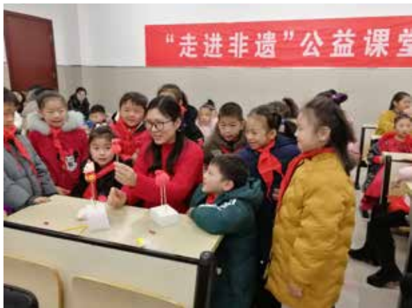
· 如皋市文化馆“非遗公益课堂”。